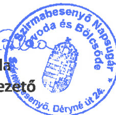
Rácz Csilla intézményvezető